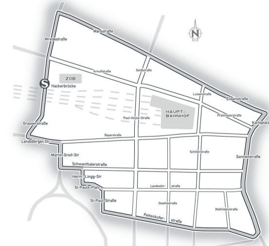
Anlage 3 zu § 2 Abs. 8 FSTTO - Zone Hauptbahnhof